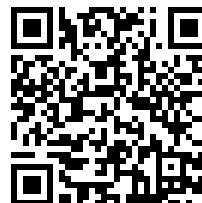
Invia richiesta di inserimento in classifica

AVVISO: Quando si invia una protesta, una richiesta o un rapporto, la procedura rimane invariata (come da Regole di Regata e Istruzioni di Regata).