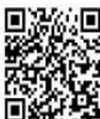
Modulo di protesta

Avviso: L'Albo Ufficiale dei Comunicati (AUC) rappresenta la sola fonte ufficiale di informazioni per questa regata.