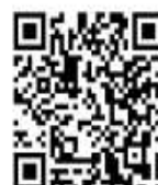
Invia richiesta di inserimento in classifica

AVVISO: Quando si invia una protesta, una richiesta o un rapporto, la procedura rimane invariata (come da Regole di Regata e Istruzioni di Regata).